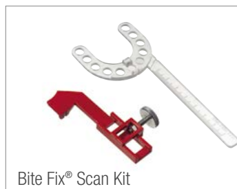
Bite Fix® Scan Kit

Und: Durch die integrierte Sollbruchstelle an der Bissgabel ist Bite Fix® Scan passend für jeden Scanner.