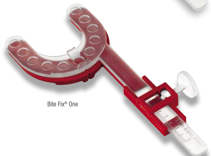
Bite Fix® One

Diese Eigenschaften haben unsere Bite Fix® Bissregistrierungen gemeinsam: