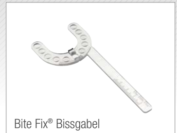
Bite Fix® Bissgabel