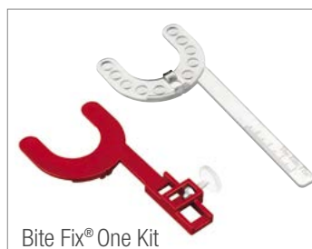
Bite Fix® One Kit

Bite Fix® One ist preisgünstig und anwenderfreundlich.