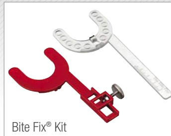
Bite Fix® Kit

Zudem ist die Bite Fix® Bissregistrierung aus sterilisierbarem Kunststoff, der Grundkörper (rot) ist mehrfach verwendbar.