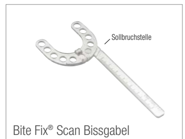
Bite Fix® Scan Bissgabel