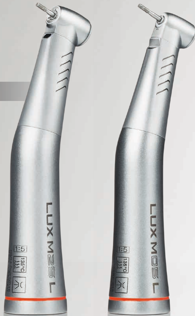
KaVo MASTERmatic M25 L